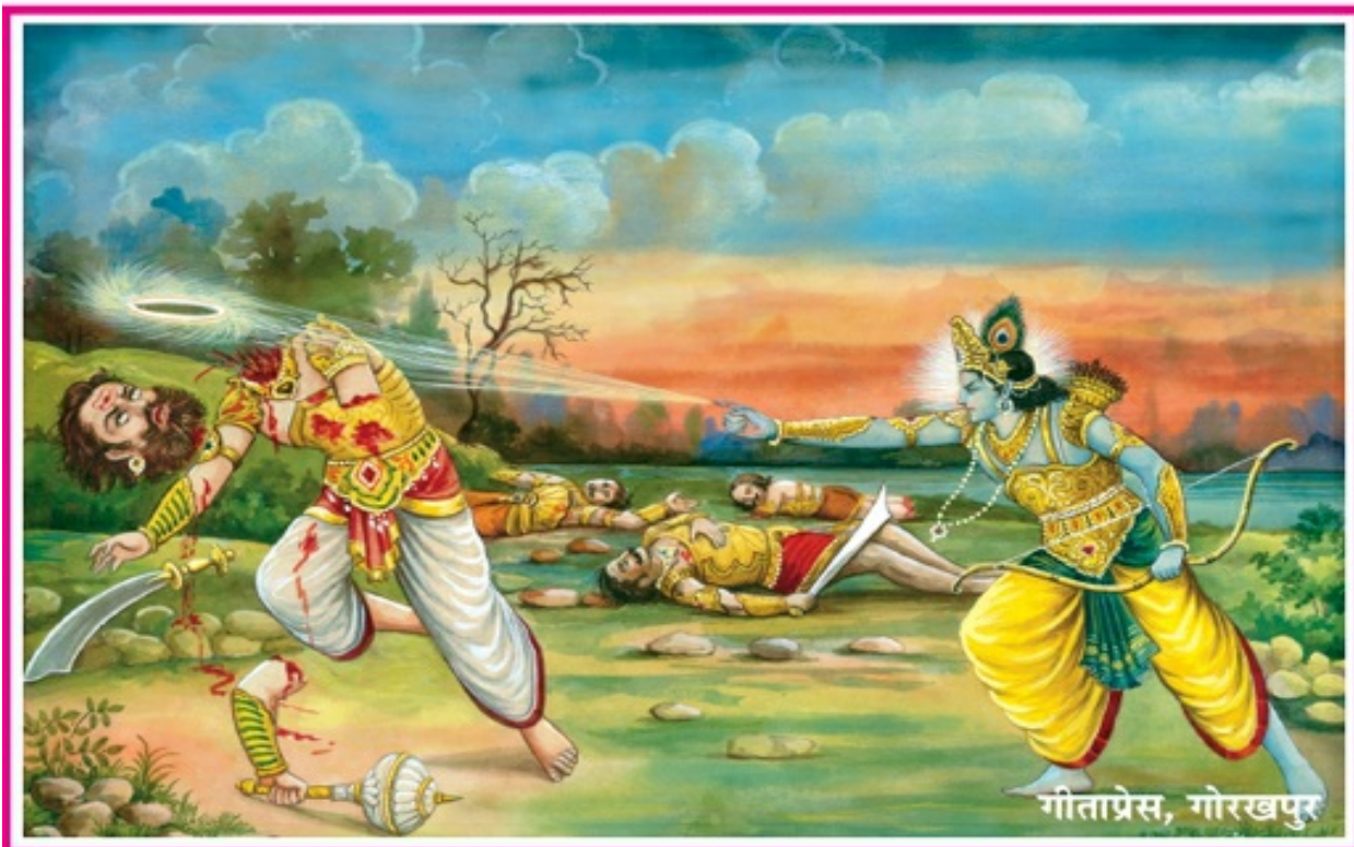
दन्तवक्र और विदूरथका उद्धार