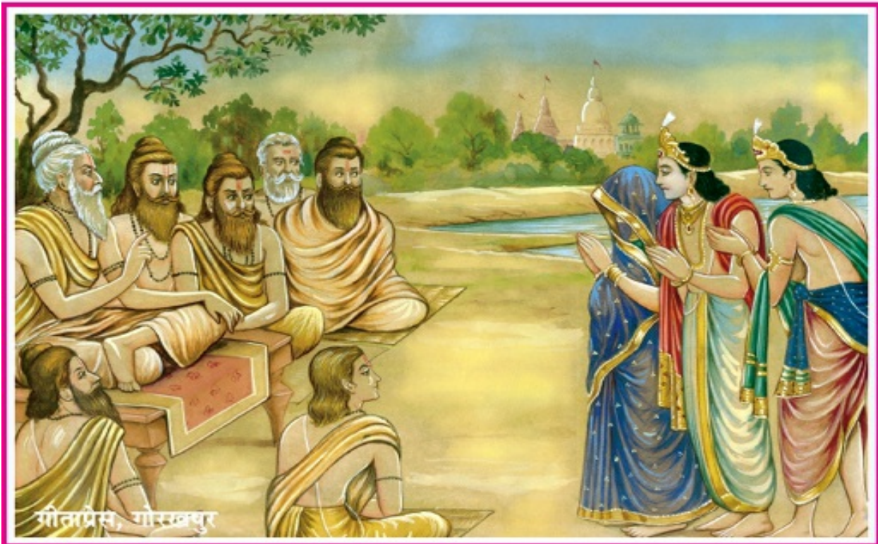
यदुकुलके विनाशका शाप