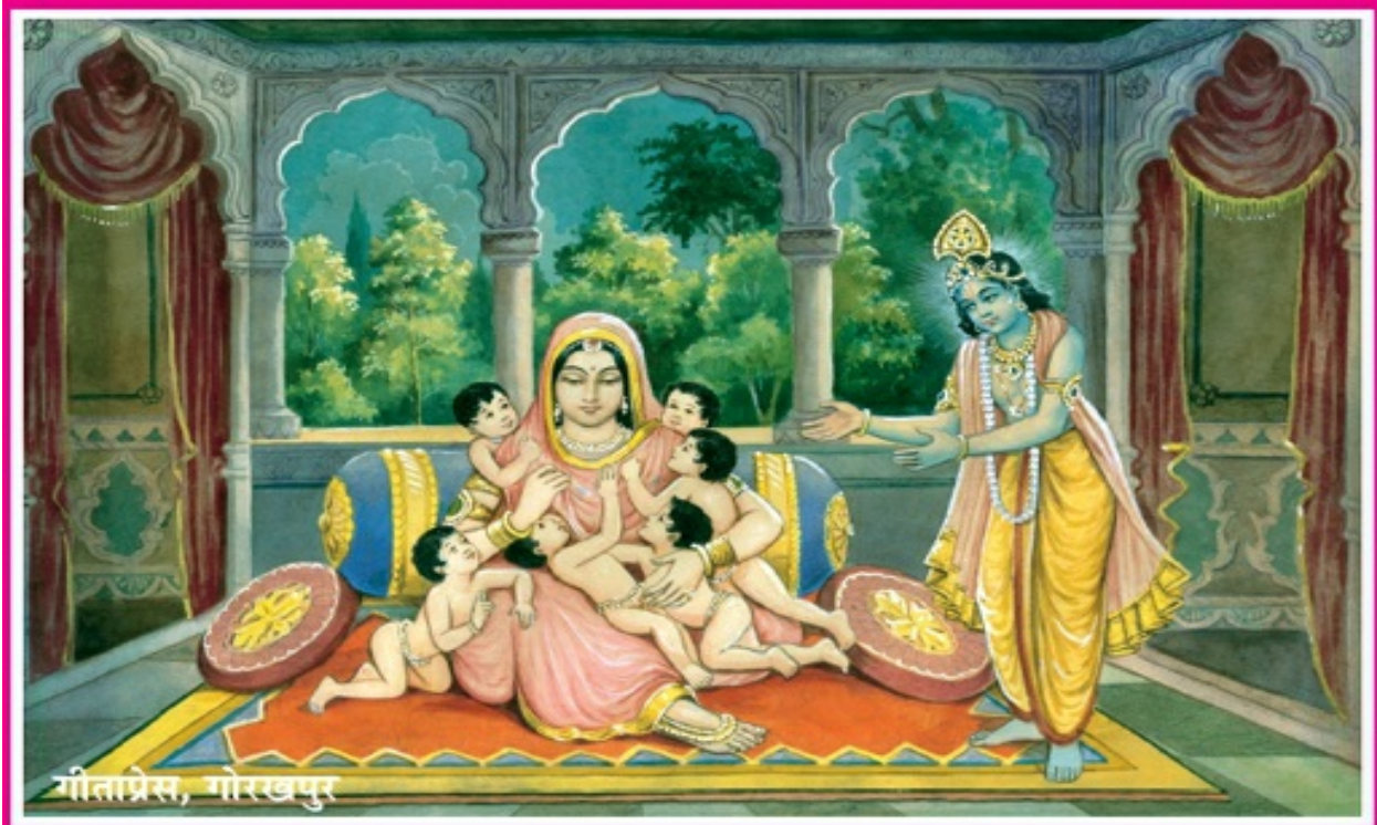
माता देवकीके मृत पुत्रोंको वापस लाना